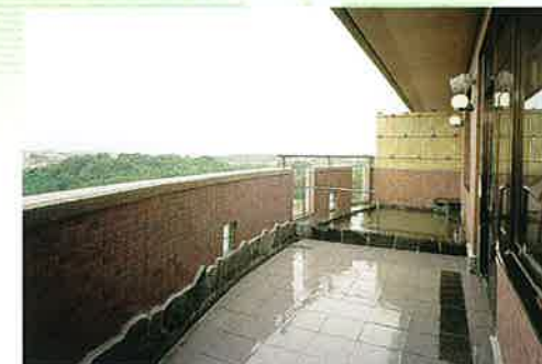
ケアハウス露天風呂