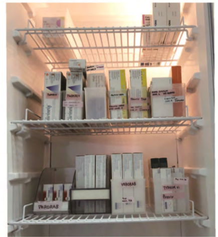
トラベラーズワクチン