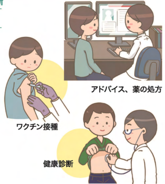
アドバイス、薬の処方

※海外渡航目的だけでなく、国内における感染症予防を目的としたワクチン接種も可能です。 ※受診には、事前のご予約が必要となります。 ※自費診療。お支払いには、クレジットカードや電子マネーもご利用可能です。